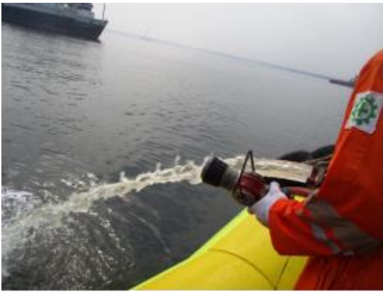
Gambar 3. Selang dilepaskan dari nozel

b. Baterai EPIRB dan HRU telah expired (Tabel 4.2 audit item, section 10.10)