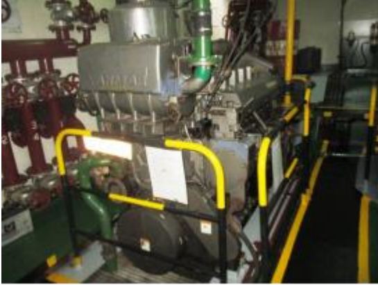
Gambar 2. Main Engine

kebocoran, akibatnya adalah akan terjadi kebakaran bahkan ledakan.