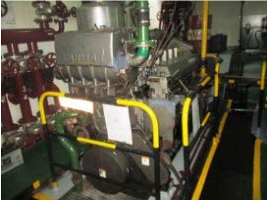
Gambar 2. Main Engine

kebocoran, akibatnya adalah akan terjadi kebakaran bahkan ledakan.