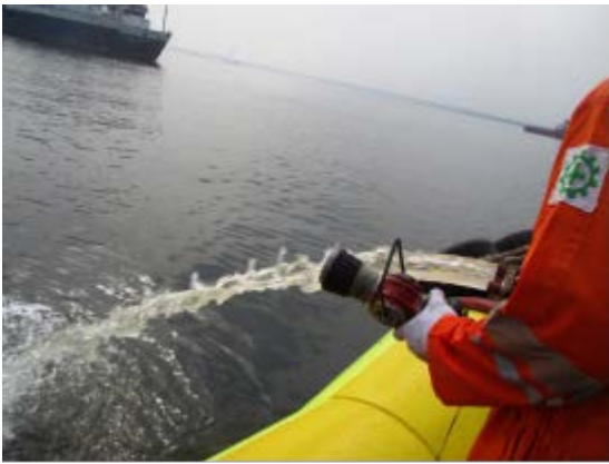
Gambar 3. Selang dilepaskan dari nozel

b. Baterai EPIRB dan HRU telah expired (Tabel 4.2 audit item, section 10.10)