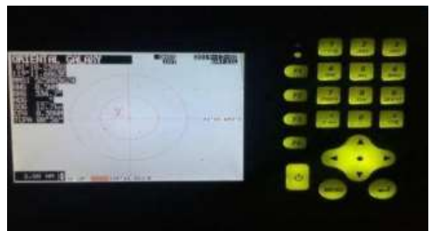
Gambar 1. Tampilan Tombol AIS Pada MV. Dahlia Merah

Berikut merupakan tampilan tombol AIS pada MV. Dahlia Merah ditunjukkan oleh Gambar 1 berikut.